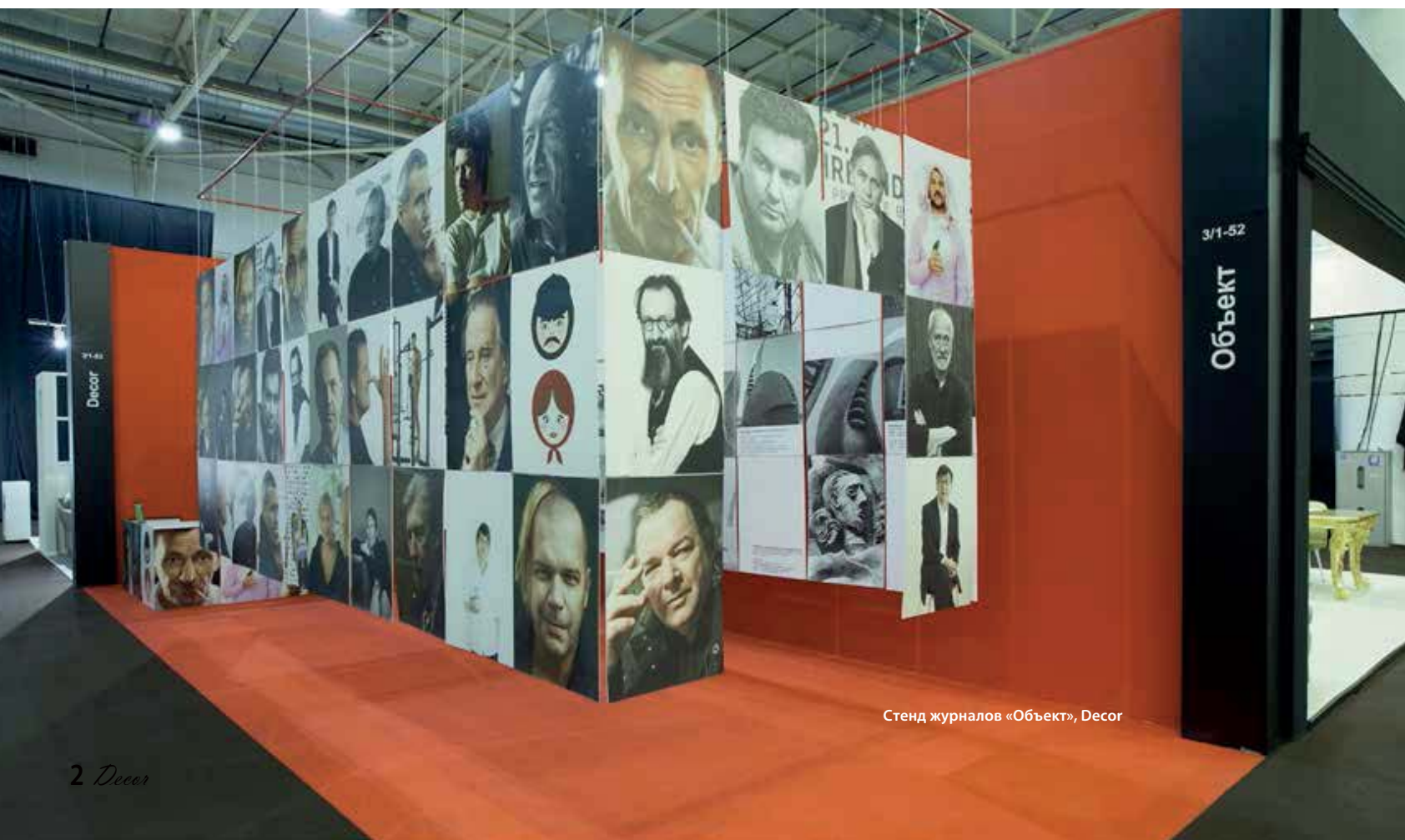
Стенд журналов «Объект», Deco