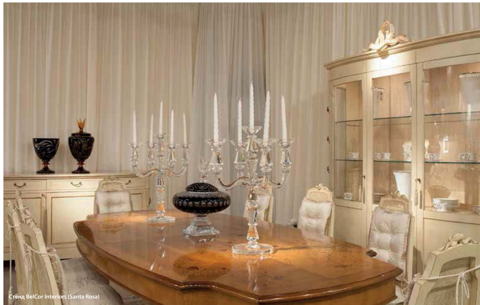
Стенд BelCor Interiors (Santa Rosa)

Итальянская мебель притягивает — ее хочется купить еще до того, как увидишь клеймо с надписью «made since...»