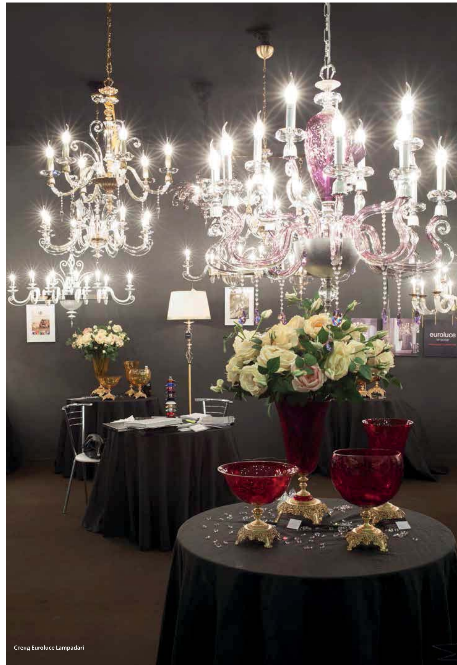
Стенд Euroluce Lampadari